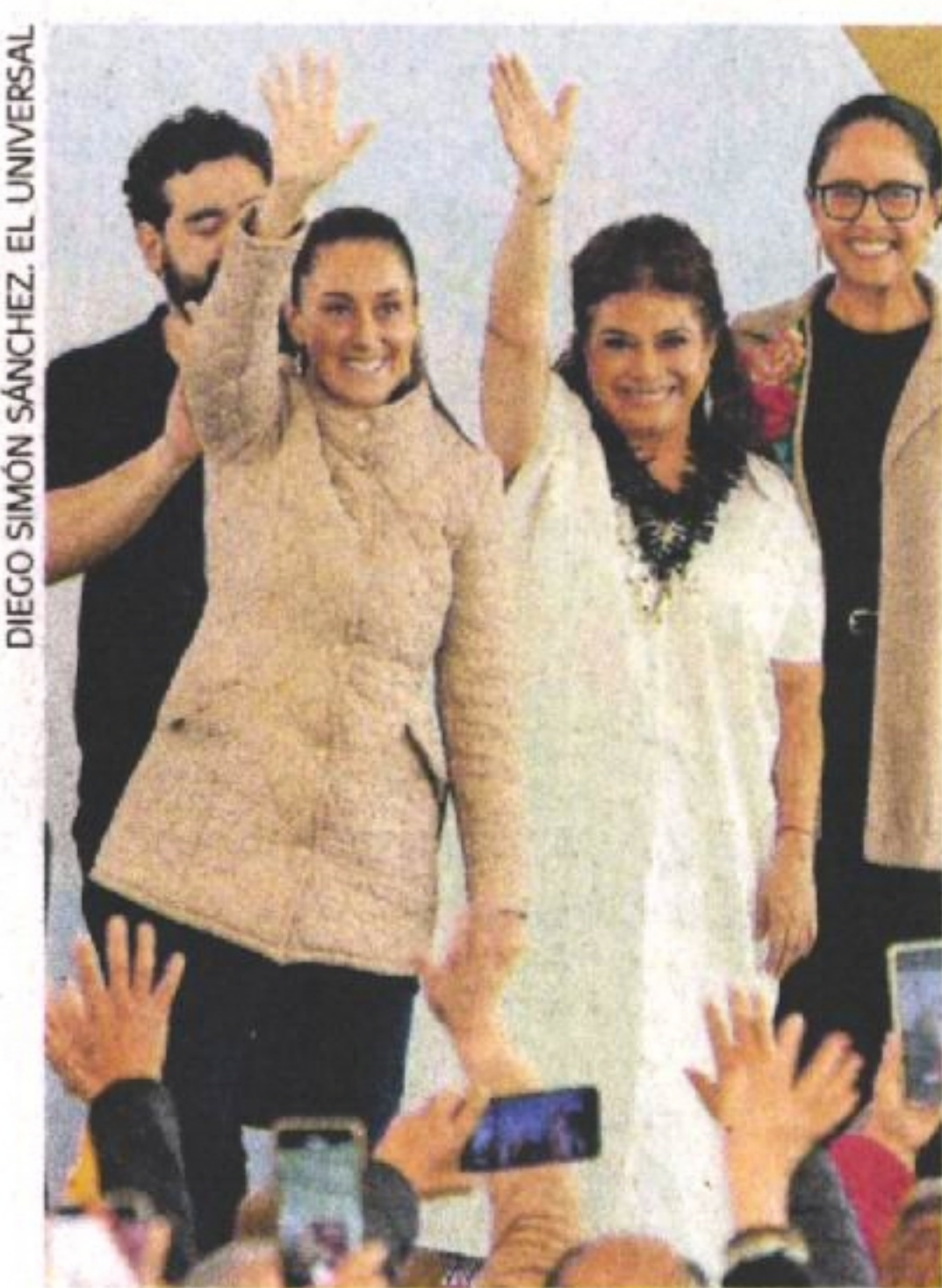
Claudia Sheinbaum y Clara Brugada anunciaron la Línea 4 del Cablebús.